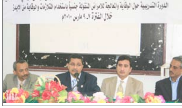
لدى افتتاح الدورة التدريبية للعاملين الصحيين حول الإيدز بمحافظة صنعاء

عن كيفية التعامل مع الأمراض الجنسية المعدية خصوصاً مرض الإيدز. وأوضح أن للكلمة والنصيحة دوراً مهماً جداً في تصحيح بعض الممارسات الطبية والصحية الخاطئة التي تؤدي إلى انتقال المكتسبة الإيدز. وأكد أن نشر الوعي بهذا المرض يعتبر وسيلة ناجحة للوقاية منه ومكافحة انتشاره داعياً المشاركين في الدورة إلى تحمل مسؤولياتهم المهنية تجاه المتعاشين مع المرض وأن يعملوا على نقل ما تلقوا من معارف إلى زملائهم في العمل لتصل إلى أكبر عدد من العاملين الصحيين. وأعرب عن شكره للأمانة العامة للمجلس الوطني للسكان على الجهود المبذولة في إقامة مثل هذا النشاط في إطار التنسيق المشترك مع البرنامج الوطني لمكافحة الإيدز والتي يأمل من الأخصائيين وأخذ الاحتياطات الطبية اللازمة أثناء التعامل مع المرض حتى لا يصابوا بأي فارق بينه وبين الآخرين. ودعا الجميع إلى أن يأخذوا النصائح والإرشادات الوقائية حول طرق انتقال هذا المرض وكيفية الوقاية منه ونقلها إلى الآخرين لتعزيز الوعي في المجتمع حول هذا المرض.