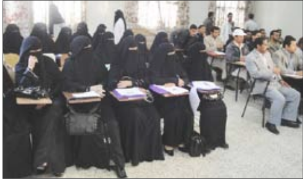
جانب من العاملين الصحيين المشاركين في الدورة التدريبية